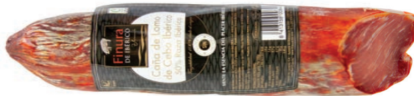
CAÑA DE LOMO DE CEBO IBÉRICO 50% RAZA IBÉRICA - 1/2 PIEZA FATTENED IBERIAN PORK LOIN 50% IBERIAN - 1/2 PIECE LOMO DE « CEBO » 50 % RACE IBÉRIQUE – 1/2 PIÈCE

Peso unidad - Weight unit - Poids unitaire: 1,35 kg aprox. Unidades/caja - Units/box - Unités/boîte: 2 uni. Peso/caja - Weight/box - Poids/boîte: 2,7 Kg. aprox.