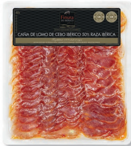
CAÑA DE LOMO DE CEBO IBÉRICO 50% RAZA IBÉRICA - L80G FATTENED IBERIAN PORK LOIN 50% IBERIAN - L80 G LOMO DE « CEBO » 50 % RACE IBÉRIQUE - L80 G 55306L

Peso unidad - Weight unit - Poids unitaire: 80 g aprox. Unidades/caja - Units/box - Unités/boîte: 16 uni. Peso/caja - Weight/box - Poids/boîte: 1,28 Kg. aprox.