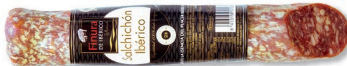
SALCHICHÓN IBÉRICO CULAR IBERIAN CURED SAUSAGE SAUCISSON IBÉRIQUE

Peso unidad - Weight unit - Poids unitaire: 700 g aprox. Unidades/caja - Units/box - Unités/boîte: 4 uni. Peso/caja - Weight/box - Poids/boîte: 2,8 Kg. aprox.