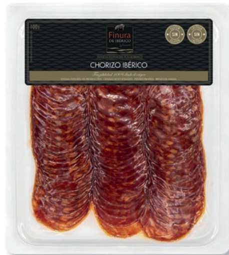
CHORIZO IBÉRICO - L100G IBERIAN CHORIZO - L100 G CHORIZO IBÉRIQUE - PL100 G 55313L

Peso unidad - Weight unit - Poids unitaire: 100 g aprox. Unidades/caja - Units/box - Unités/boîte: 16 uni. Peso/caja - Weight/box - Poids/boîte: 1,6 Kg. aprox.