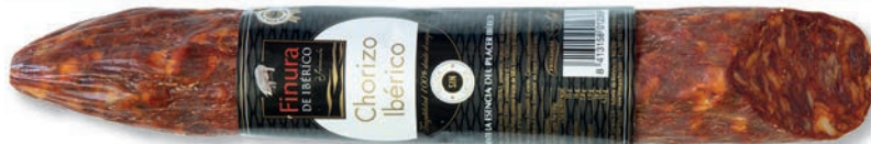
CHORIZO IBÉRICO IBERIAN CHORIZO CHORIZO IBÉRIQUE

Peso unidad - Weight unit - Poids unitaire: 640 g aprox. Unidades/caja - Units/box - Unités/boîte: 4 uni. Peso/caja - Weight/box - Poids/boîte: 2,5 Kg. aprox.