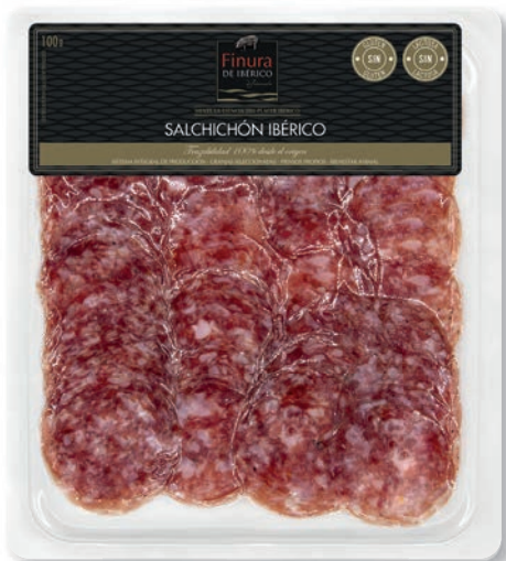
SALCHICHÓN IBÉRICO - L100G CULAR IBERIAN CURED SAUSAGE - L100 G SAUCISSON IBÉRIQUE - L100 G 55310L

Peso unidad - Weight unit - Poids unitaire: 80 g aprox. Unidades/caja - Units/box - Unités/boîte: 16 uni. Peso/caja - Weight/box - Poids/boîte: 1,28 Kg. aprox.